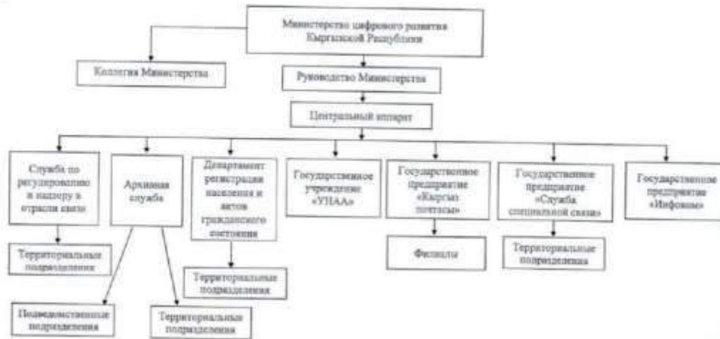
Схема управления Министерства цифрового развития Кыргызской Республики